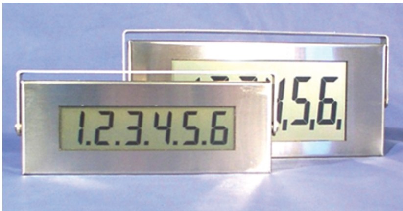
Bilden visar displayer med bakgrundsbelysning

Tillbehör: bakgrundsbelysning, kapslad enl IP65 mm